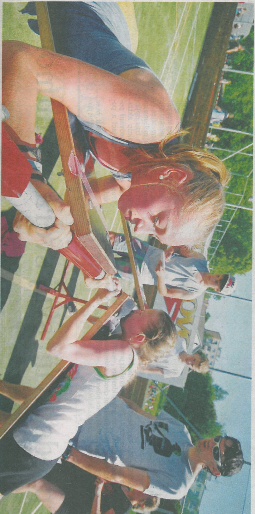
KLANÍ. Ve sportovním areálu havlíčkovrodské základní školy Wolkerova se včera uskutečnilo krajské kolo Odznaku všestrannosti olympijských vítězů. Nejlepší týmy z jednotlivých okresů Vysočiny se utkali v několika disciplínách o postupové místo do zářijového republikového finále. Na výkony mladých sportovců v Havlíčkově Brodě dohlížely ikony českého a československého sportu Šárka Kašpárková a Gejza Valent. Výsledky krajského kola budou vyhlášeny dnes.